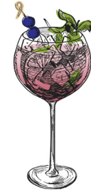
Olivia mule malfy giniä, inkivääriolutta, soodaa, limeä, mustikkaa, minttua malfy gin, ginger beer, soda, lime, blueberries, mint