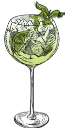
Hugo spritz prosecco, seljankukkaliikööriä, limemehua, minttua prosecco, elderflower liqueur, lime juice, mint