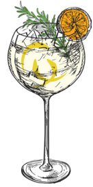
Olivia gin tonic malfy giniä, tomarchio tonicia, rosmariinia, sitruunaa, appelsiinia malfy gin, tonic tomarchio, rosemary, lemon, orange